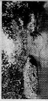
Vestiges du pont Las Trilles à la confluence Lèze-Ariège.