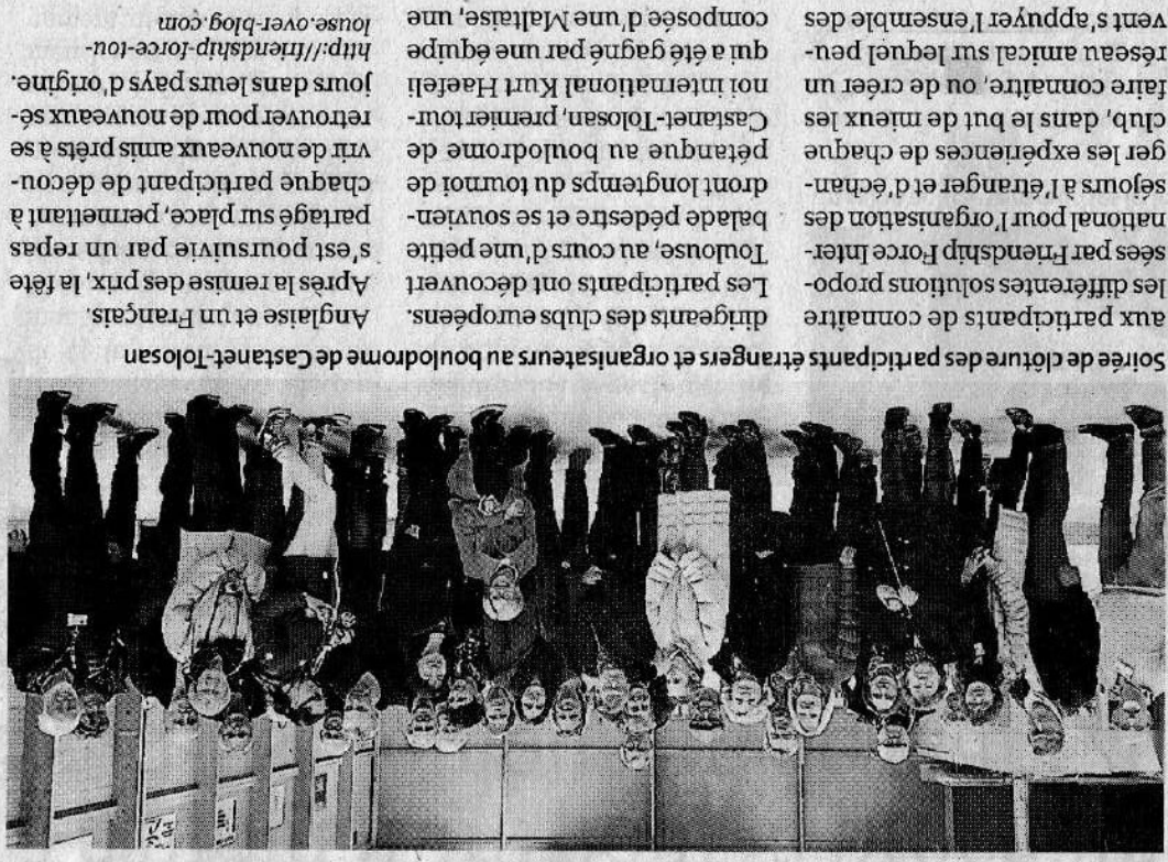
Soirée de clôture des participants étrangers et organisateurs au boudodrome de Castanet-Tolosan